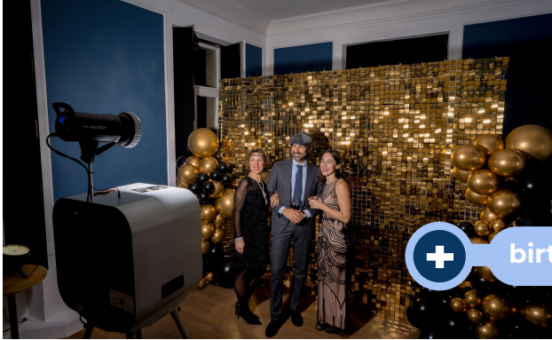
+ birthday, wedding..